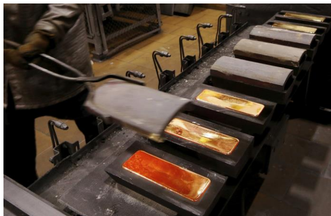
Jak se vyrábí zlaté cihly, nám ukazuje fotografie.

Možná by vás mohlo zajímat, jak se vlastně vytvořil zlatý poklad České republiky. Československý (český) zlatý poklad vznikl od nuly v období krátce po skončení první světové války, kdy vláda rozhodla o vytvoření tzv. zlaté rezervy, jejímž účelem bylo krytí domácího oběživa a později též zavedení zlaté měny coby třetí a závěrečné fáze Rašínovy měnové reformy. Rezervu tvořilo 12,1 tuny zlata převedeného z Rakousko-uherské banky, dále z dobrovolných darů, čtyřleté 4% půjčky ve zlatě, stříbře a valutách, z nezpracovaného zlata, stříbra, zlatých a stříbrných mincí a zahraničních papírových peněz, z prostředků, které připlynuly v důsledku zavedení nabídkové povinnosti valut a deviz apod. Ke konci ledna v roce 1922 činily zásoby zlata 19,9 tuny (a k tomu více jak 5 tun stříbra), v roce 1925 již 40,8 tuny, v roce 1929 56,2 tuny a k 15. září 1938 cca 96,6 tuny. Vzhledem k hrozbě války a rovněž z likviditních důvodů byla jen malá část uložena přímo v Praze (6,3 tuny), většina zlata byla uložena v různých zahraničních bankách, zejména v Británii a ve Švýcarsku. V Bank of England to bylo 28,3 tuny na účtu Banky pro mezinárodní platby (Bank for International Settlements - BIS) a 26,8 tuny na účtu Národní banky československé. Ze 70 tun měnového zlata, které ČNB připadlo po rozdělení Československa, bylo již rozprodáno cca 60 tun.