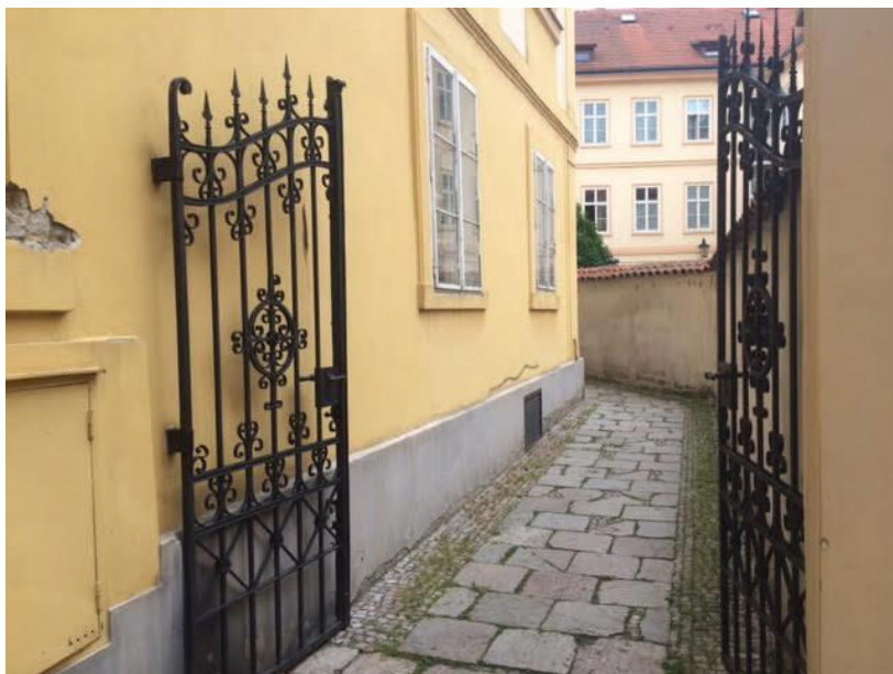
Pohled do ulice Zlaté. Pozor, nezaměňovat se Zlatou uličkou na Pražském hradě.

Nápověda: Číslice v modré tabulce (orientační číslo domu) na domě, kde byly přechodně uchovávány desky zemské (dům na rohu ulice Zlaté a Husovy).