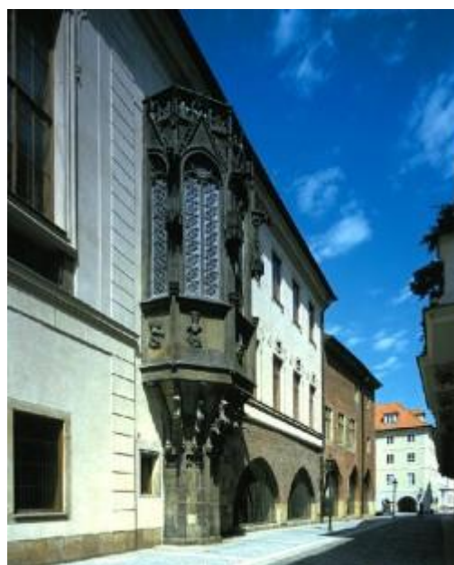
Dochovaný gotický arkýř je opravdu nádherný.