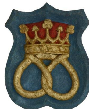
Znak cechu pekařů v Mostě v kostele Nanebevzetí Panny Marie.

Pekaři ve středověku patřili vedle řezníků mezi nejbohatší řemeslníky, jejich činnost byla ale už od 14. století také předmětem úřední kontroly. Koš na potápění nepoctivých pekařů do řeky byl z Karlova mostu odstraněn až roku 1688.