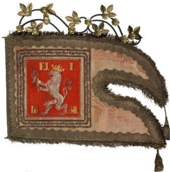
Korouhev cechu pražských židovských řezníků je ve sbírkách pražského židovského muzea.

Teď jsme se dostali do ulice, jež nám sice podle názvu žádné řemeslo nepřipomíná, ale pro jedno řemeslo je velice důležitá. V této ulici žil v 15. století bohatý novoměstský řezník Jan Vodička a právě podle něj se již pět století tato ulice jmenuje. Řezník Vodička vlastnil v ulici tehdy největší dům (č. p. 699), na jehož místě stojí právě palác, u kterého stojíte.