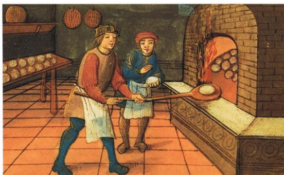
Na přemyslovském dvoře se peklo přes 20 druhů chleba.

Celetnou ulici vybuďovali původně kupci a řemeslníci. Brzy se ale stala ulicí měšťanů, královských úředníků a vysoké aristokracie. Také proto, že zde měl král v Královodvorské ulici své domy.